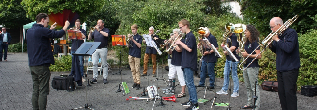
Platzkonzert unseres Posaunenchores