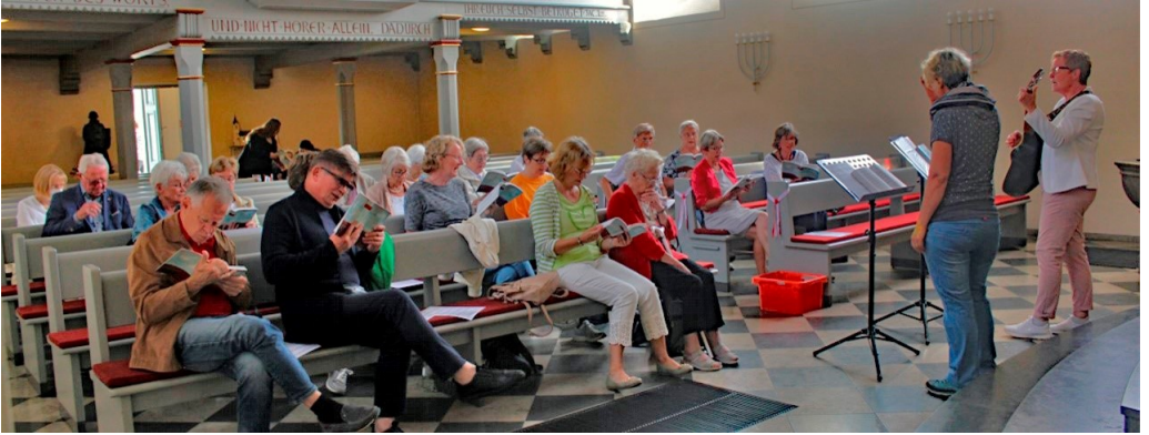
Offenes Singen in der Martin-Luther-Kirche