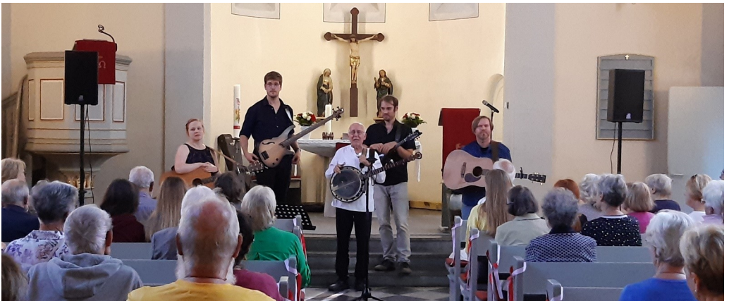
Höhepunkt zum Abschluss: Konzert mit „Gospel spontan“